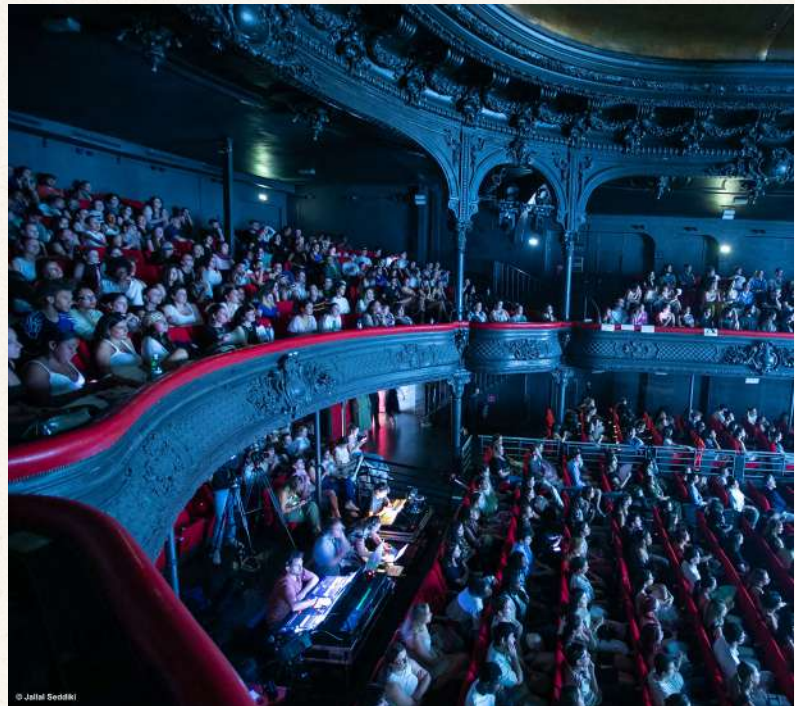
Cérémonie de Remise des Prix 2025, à La Cigale à Paris

Plus de 2 300 étudiants issus des six campus ESP (Paris, Bordeaux, Lyon, Toulouse, Nantes et Lille) ont pris part à cette aventure pédagogique ambitieuse. Organisés en agences de communication , ils ont travaillé pendant dix jours sur des problématiques environnementales proposées par 12 annonceurs , parmi lesquelles Sea Shepherd, Fondation GoodPlanet, Bilum, Swim for Change, Sport 2048, Accor, Kignon, BforBank, Solidarités Nouvelles pour le Logement, Valeo, Jabu, La Conciergerie solidaire.