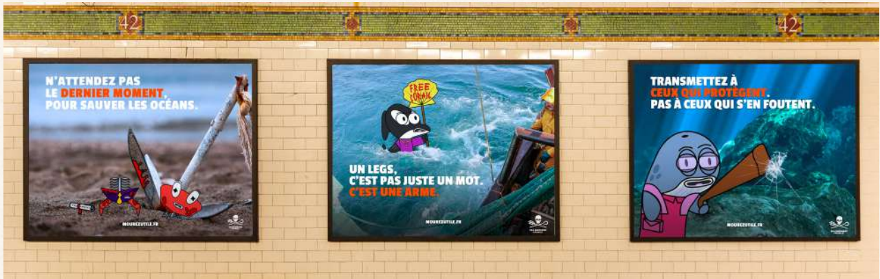
Mockup métro de la campagne d'affichage « Dans l'eau delà » de l'agence Ratpi (Sea Shepherd)

Pour encourager les Français à considérer le legs comme un acte de transmission engagé , les étudiants de l'agence Ratpi ont conçu la campagne « Dans l'eau delà », portée par la signature percutante : « Mourir utile, c'est un peu vivre deux fois ». Traitée avec humour et audace, leur proposition déploie une stratégie de communication 360° mêlant réseaux sociaux, mailing, affichage et brochure. Une campagne complète, pensée pour lever les tabous autour du legs et en révéler le potentiel solidaire.