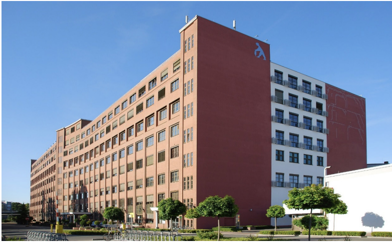
HMKW - Francfort