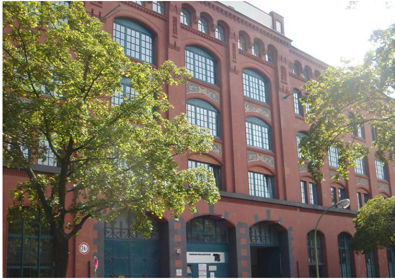
HMKW - Berlin