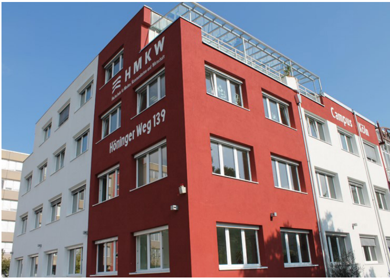
HMKW - Cologne