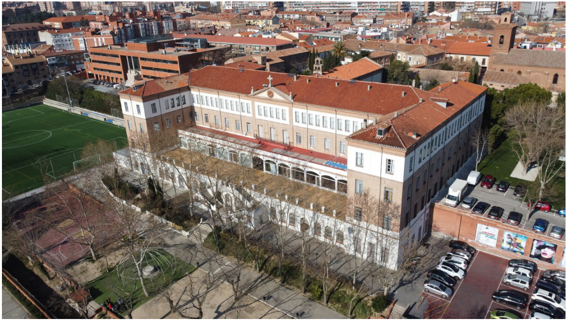
CES - Escuela Superior de Imagen y Sonido