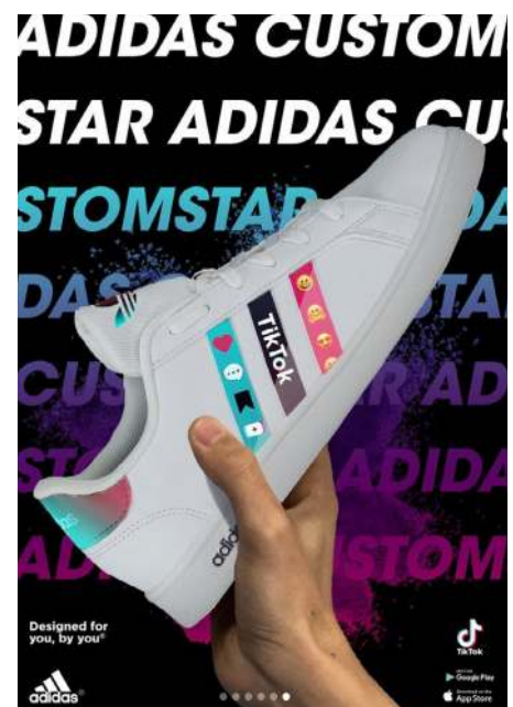
Reebok x Lego, Puma x Ikéa, Adidas x TikTok