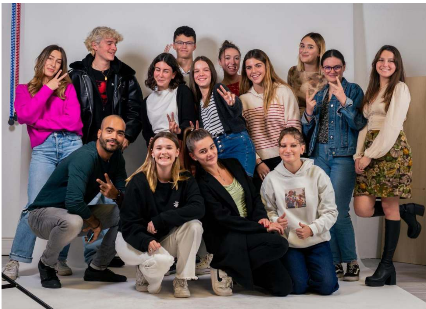
À l'ESP Bordeaux, les futurs communicants prennent la pause lors du stage d'orientation.

Au-delà de l'information et de la mise en situation réelle, ces stages leur offrent également la possibilité, le temps des vacances scolaires, de partager un moment d'échange avec d'autres étudiants et de découvrir de façon ludique et créative les différents cursus de l'ESD et de l'ESP.